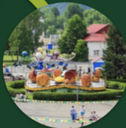
БОЛЬШОЙ ПАРК И НАБЕРЕЖНАЯ