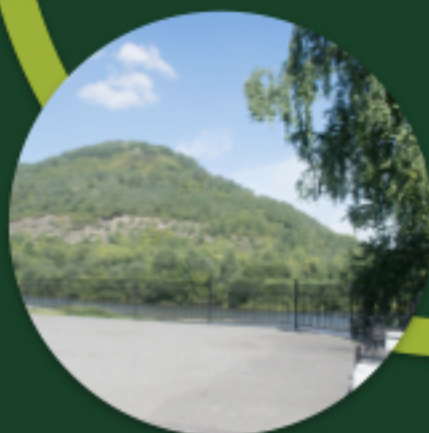
ВИДЫ НА ГОРНЫЕ РЕКИ